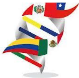
ALIANZA DEL PACÍFICO

Adicionalmente, se presentó una estrategia de comunicación que adoptará la Alianza del Pacífico para proyectar su imagen al mundo. En el encuentro, los Grupos Técnicos reportaron avances al GAN. En materia de comercio e integración se revisaron propuestas de términos de referencia sobre acceso a mercados y reglas de origen, se abordaron temas de cooperación regulatoria y buenas prácticas regulatorias; además de otros temas de interés para las partes, relacionados con medidas sanitarias y fitosanitarias. En servicios y capitales se avanzó en las propuestas de texto sobre servicios e inversión, entre otros.