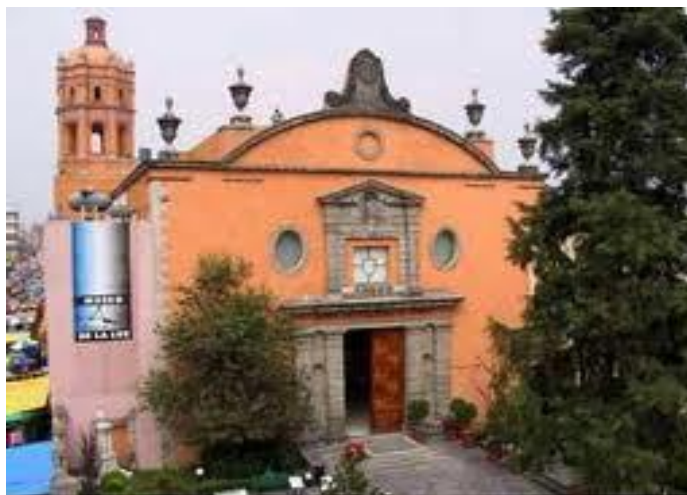
Templo de San Pedro y San Pablo

Dicha decisión causó malestar entre los partidarios de la creación de una república, entre ellos Vicente Guerrero y Guadalupe Victoria. En diciembre de 1822, Antonio López de Santa Anna –hasta entonces soldado al servicio de la corona española- proclamó el Plan de Veracruz, provocando que antiguos insurgentes de ideas republicanas, se levantaran en armas. En febrero de 1823, se firmó el llamado Plan de Casa Mata, por el cual se unieron realistas y republicanos para luchar por el derrocamiento de Iturbide. La aventura imperial –que dicho sea de paso, logró el ensanchamiento del territorio mexicano, al conseguir que la mayor parte de Centroamérica se uniera al imperio-, terminó el 19 de marzo de 1823, cuando Iturbide tuvo que renunciar y partir al exilio.