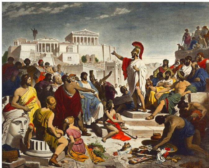
La Plaza del Ágora (Atenas)

Atenas llegó a la democracia después de una larga evolución de reformas políticas, que tuvieron lugar durante el siglo VI a.C. y que se consolidaron durante el gobierno de Pericles. Dicho personaje gobernó Grecia durante 30 años, a lo que se ha llamado el “Siglo de Oro de Pericles”, periodo considerado como sinónimo de brillantez intelectual, de madurez política y de democracia. Dichas ideas tuvieron amplia repercusión en las civilizaciones occidentales.