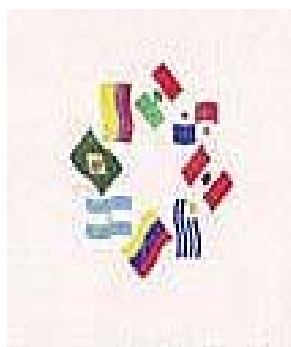
Grupo de los Ocho (Reunión Cumbre de Acapulco, 1987)