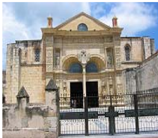
Catedral Primada, Sto. Domingo (Rep. Dom.)