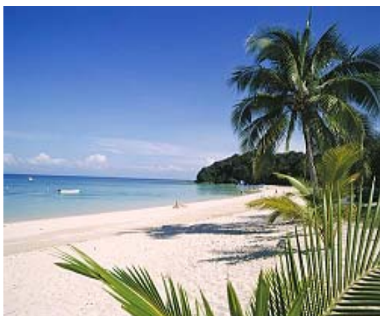
Isla Contadora (Panamá)