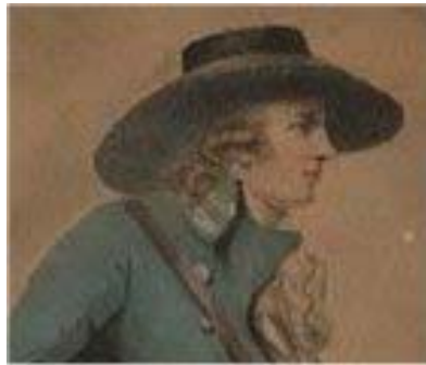
Gastón Le Conte de Rouvray Pintor George Morlan (1800)