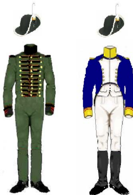
First Rifle Reg.