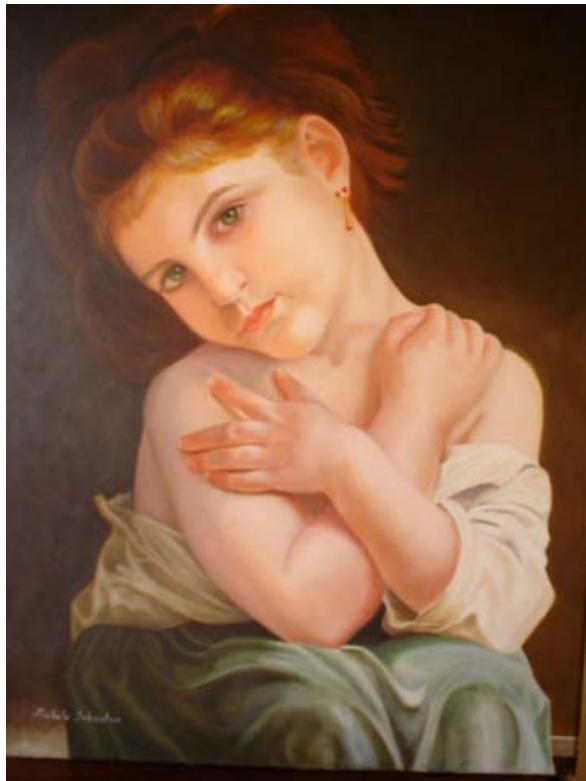
FRIOLENTA (Tomado de la obra de W. Bouguereau)