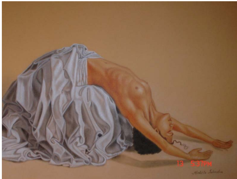
SERENIDAD (Tomado de la obra de Omar Ortiz)

A continuación tengo el agrado de presentar algunos de mis más recientes trabajos: