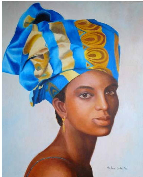
La Otra Nefertiti